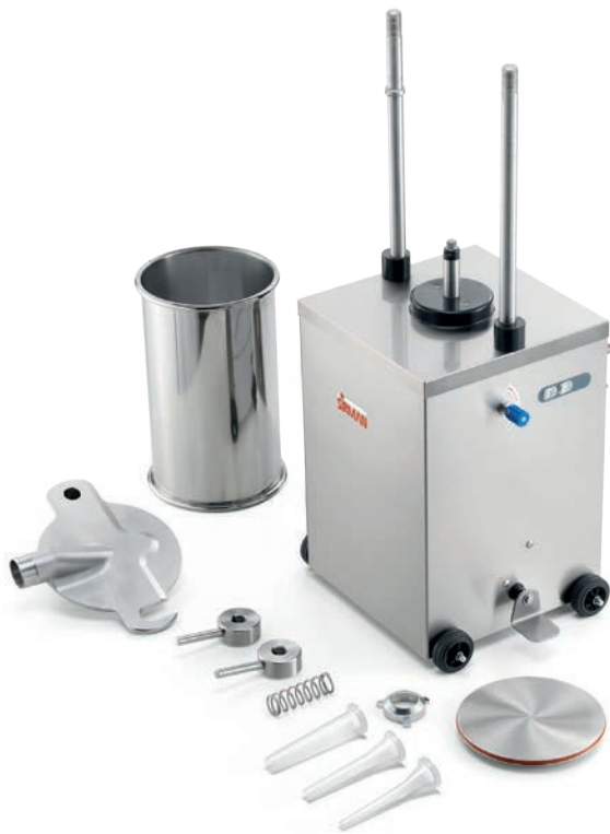
Estrema facilità di pulizia Easy to clean