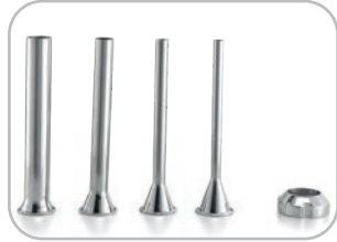
Imbuti inox (ø 16-20-28-38) Funnels in stainless steel (ø 16-20-28-38)