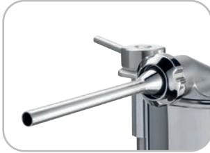
Ghiera inox Bush in stainless steel