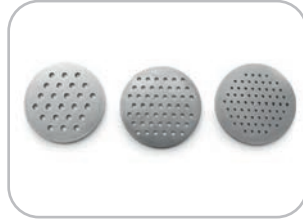
Applicazione passa patate Potato masher application