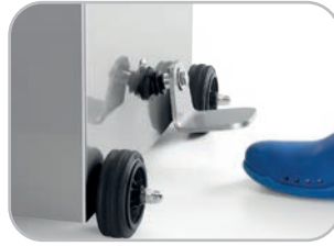
Ritorno pistone automatico Automatic piston return