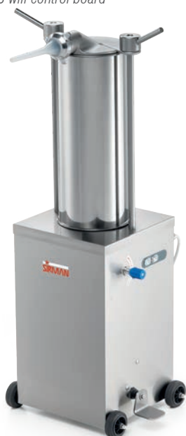
IS 15 IDRA