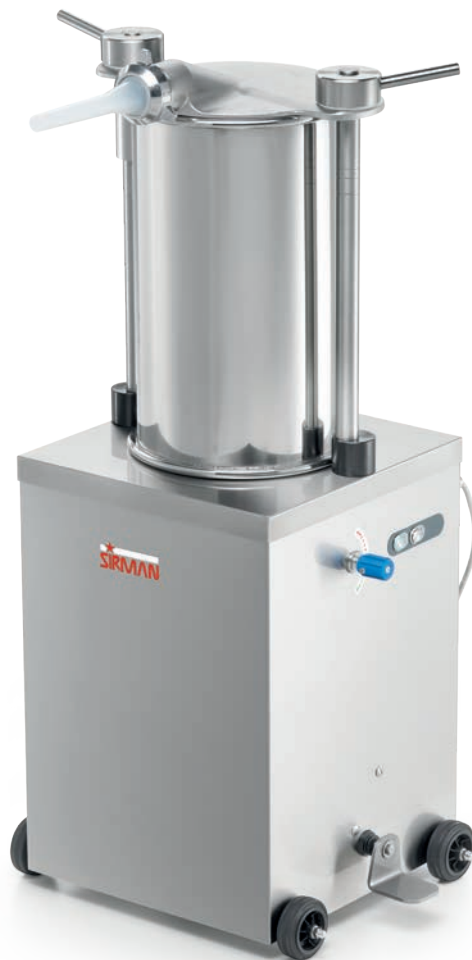
IS 25 IDRA