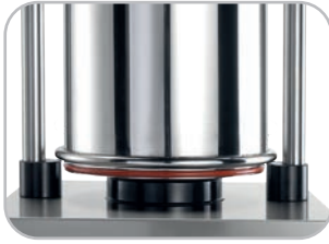
Guarnizione ermetica su cilindro oleodinamico Hermetic hydraulic piston gasket