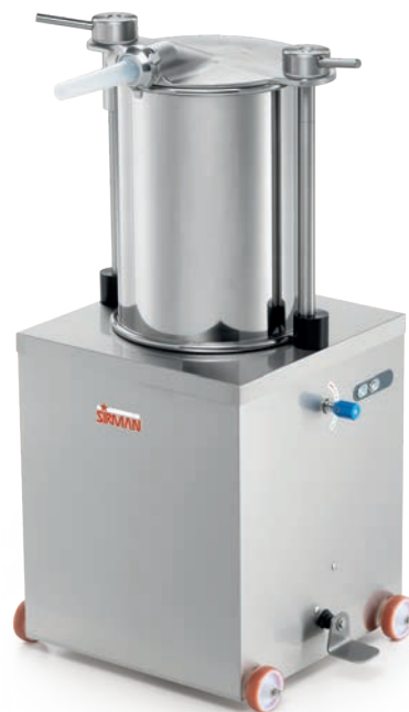
IS 50 IDRA